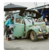
radio barkas deluxe